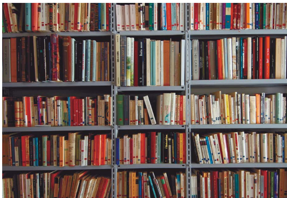
L'iniziativa del «bonus lettura» coinvolgerebbe circa 5 milioni di giovani

«L'iniziativa del "bonus lettura" proposta dalle associazioni della Filiera coinvolgerebbe circa 5 milioni di giovani, che potrebbero rappresentare già in sé un motore di sviluppo per tutta l'industria culturale. Inoltre, il fatto di riunirsi in filiera dimostra la volontà delle imprese del settore di recuperare livelli di efficacia, che le re-immettano in modo competitivo nel mercato, attraverso la ricerca di mi-